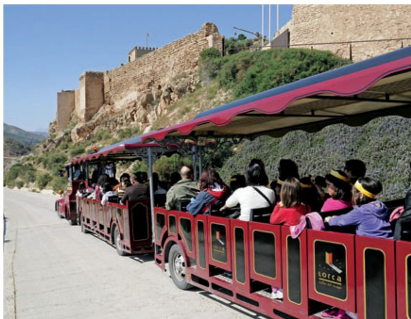
Grupo de turistas frente a la Fortaleza del Sol, en Lorca. La mayor parte de los habitantes de la Región de Murcia trabaja en el sector terciario, y el turismo es una de las actividades más destacadas.